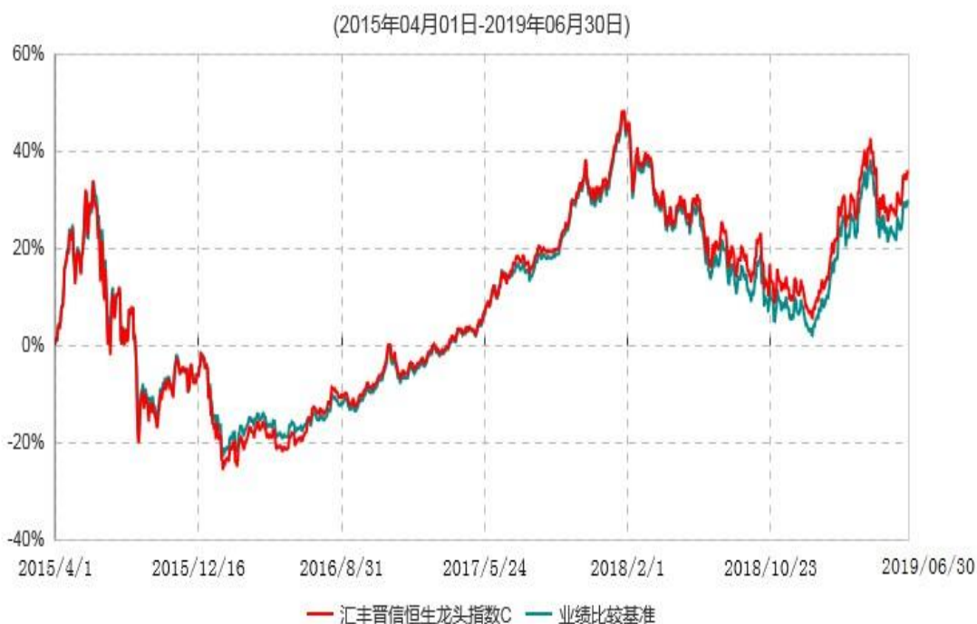
汇丰晋信恒生龙头指数C累计净值增长率与业绩比较基准收益率历史走势对比图

注：1. 按照基金合同的约定，本基金的投资组合比例为：投资于标的指数的成份股与备选成份股的组合比例不低于基金资产净值的 90%，现金（不包括结算备付金、存出保证金、应收申购款等）或到期日在一年以内的政府债券的比例不低于基金资产净值的 5%。本基金自基金合同生效日起不超过三个月内完成建仓。