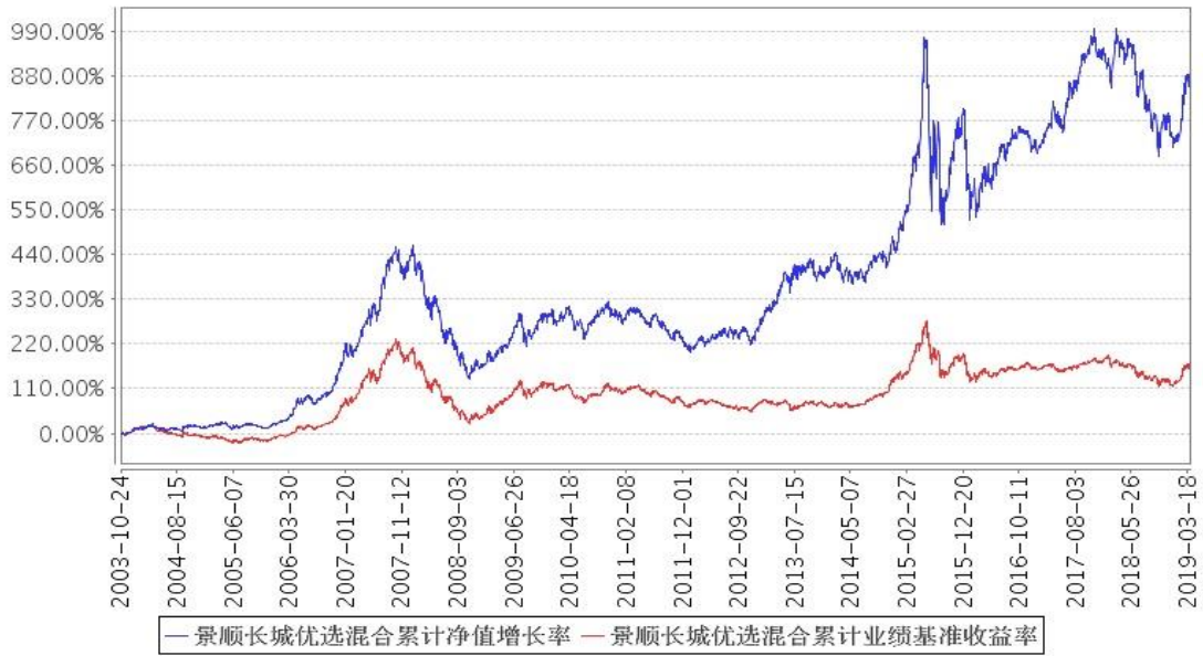
景顺长城优选混合累计净值增长率与同期业绩比较基准收益率的历史走势对比图

注：本基金的资产配置比例为：股票投资的比例为基金资产净值的 70%至 80%；债券投资的比例为基金资产净值的 20%至 30%。按照本系列基金基金合同的规定，本基金自 2003 年 10 月 24 日合同生效日起至 2004 年 1 月 23 日为建仓期。建仓期结束时，本基金投资组合均达到上述投资组合比例的要求。自 2017 年 9 月 6 日起，本基金业绩比较基准由“上证综合指数和深证综合指数的加权复合指数×80%+中国债券总指数×20%”调整为“中证 800 指数×80%+中国债券总指数×20%”。