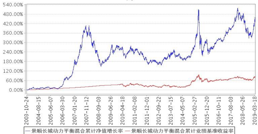
景顺长城动力平衡混合累计净值增长率与同期业绩比较基准收益率的历史走势对比图

注：本基金的资产配置比例为：股票投资的比例为基金资产净值的 20%至 80%；债券投资的