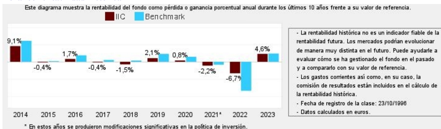
Gráfico rentabilidad histórica

Datos actualizados según el último informe anual disponible.