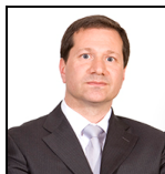
George Gosden Desde Enero 13

Sociedad gestora: Threadneedle Man. Lux. S.A. Fondo de tipo paraguas: Columbia Threadneedle (Lux) I Categoría SFDR: Artículo 6 Fecha de lanzamiento: 06/04/99 Índice: MSCI AC Asia Pacific ex Japan Index