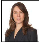
Mine Tezgul Depuis Déc 19

Société de gestion: Threadneedle Man. Lux. S.A. Fonds à compartiments multiples: Threadneedle (Lux)