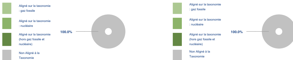
Ce graphique représente 100% du total des investissements.

Les deux graphiques ci-dessous font apparaître en vert le pourcentage minimal d'investissements alignés sur la taxonomie de l'UE. Étant donné qu'il n'existe pas de méthodologie appropriée pour déterminer l'alignement des obligations souveraines* sur la taxonomie, le premier graphique montre l'alignement sur la taxonomie par rapport à tous les investissements du produit financier, y compris les obligations souveraines, tandis que le deuxième graphique représente l'alignement sur la taxonomie uniquement par rapport aux investissements du produit financier autres que les obligations souveraines.