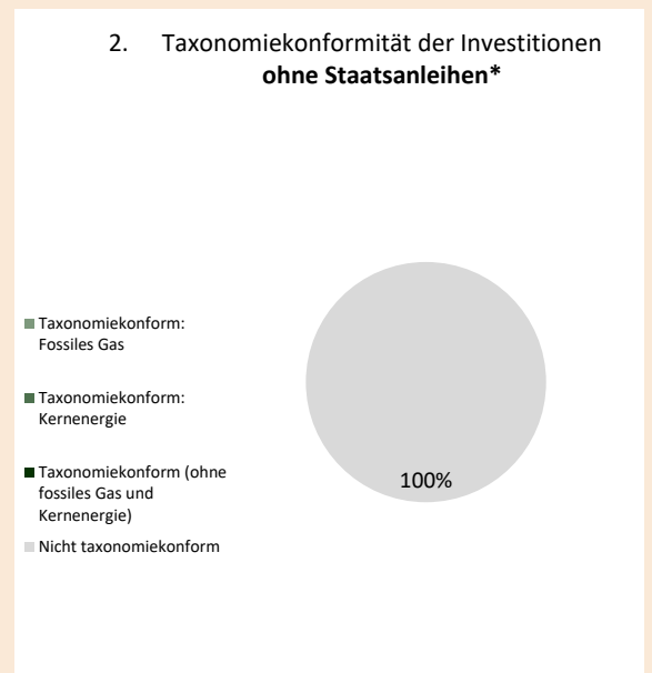
Diese Grafik gibt 100% der Gesamtinvestitionen wieder