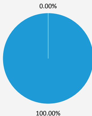
1. Taxonomie-Konformität der Investitionen einschließlich Staatsanleihen*

■ Taxonomiekonform ■ Andere Investitionen